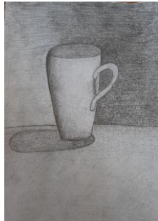
druga, popravljena risba

Tudi ta predlog še vedno velja, zato ga objavljam kar še enkrat: