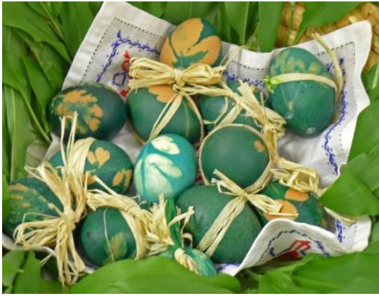
Jajca, pobarvana s čemažem.

Najbolj znan je način pridobivanja rjave ali rjavo rdeče barve s čebulnimi olupki.