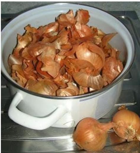
Poglej postopek izdelava drsanke - del o barvanju, najdeš ga spodaj v navodilih za bolj zahtevno nalogo.

Najbolj znan je način pridobivanja rjave ali rjavo rdeče barve s čebulnimi olupki.