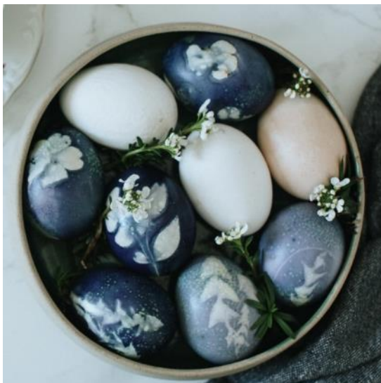
Različno nasičene modre barve.

Poskusi pobarvati več jajčk . Če imaš možnost, uporabi več različnih barvil.